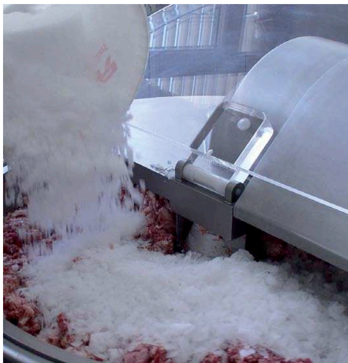
MAJA-Scherbeneiserzeuger liefern vollautomatisch und auf Knopfdruck genau die Eisqualität, die sich beim Kutturvorgang ideal mit dem Brät vermischt.

In den letzten Jahren geht die Tendenz in Richtung besonders umweltverträglicher Kältekonzepte. Vorreiter sind hier der französische und schweizerische Lebensmitteleinzelhandel, aber auch deutsche Märkte ziehen nach. Einige namhafte Gruppen