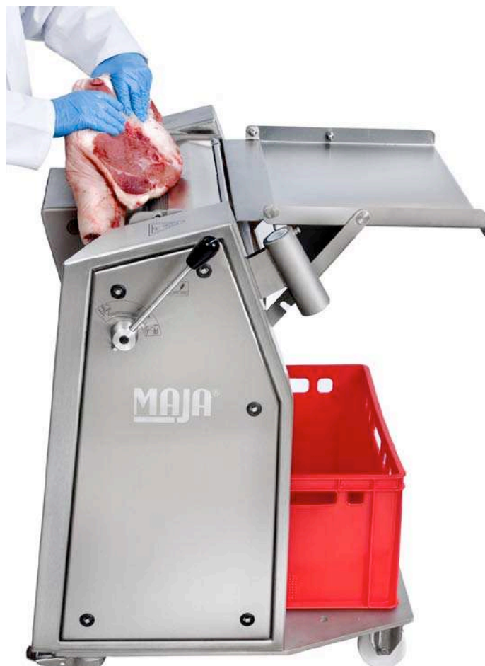
Für das manuelle Entschwarten runder Teilstücke und das Entfetten von Schinken und Schultern wurde die ESM 4550 konzipiert.

Noch im selben Jahr ging das junge Unternehmen den ersten