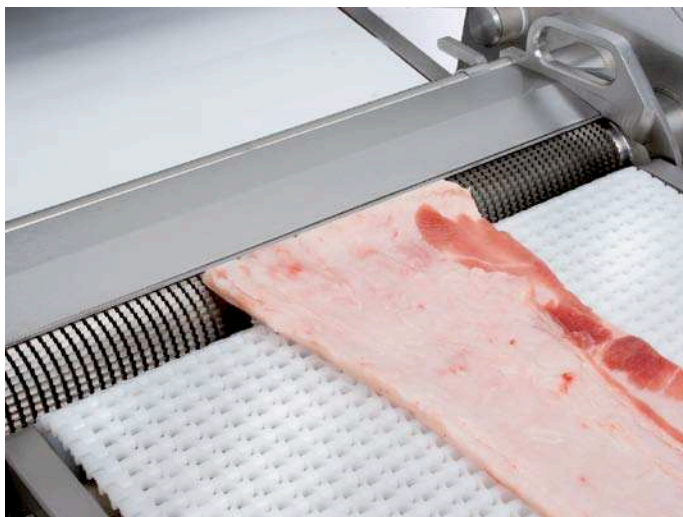
Die Band-Entschwartungsmaschine BXA eignet sich zum vollautomatischen Entschwarten von flachen Teilstücken wie Bauch und Rückenspeck.